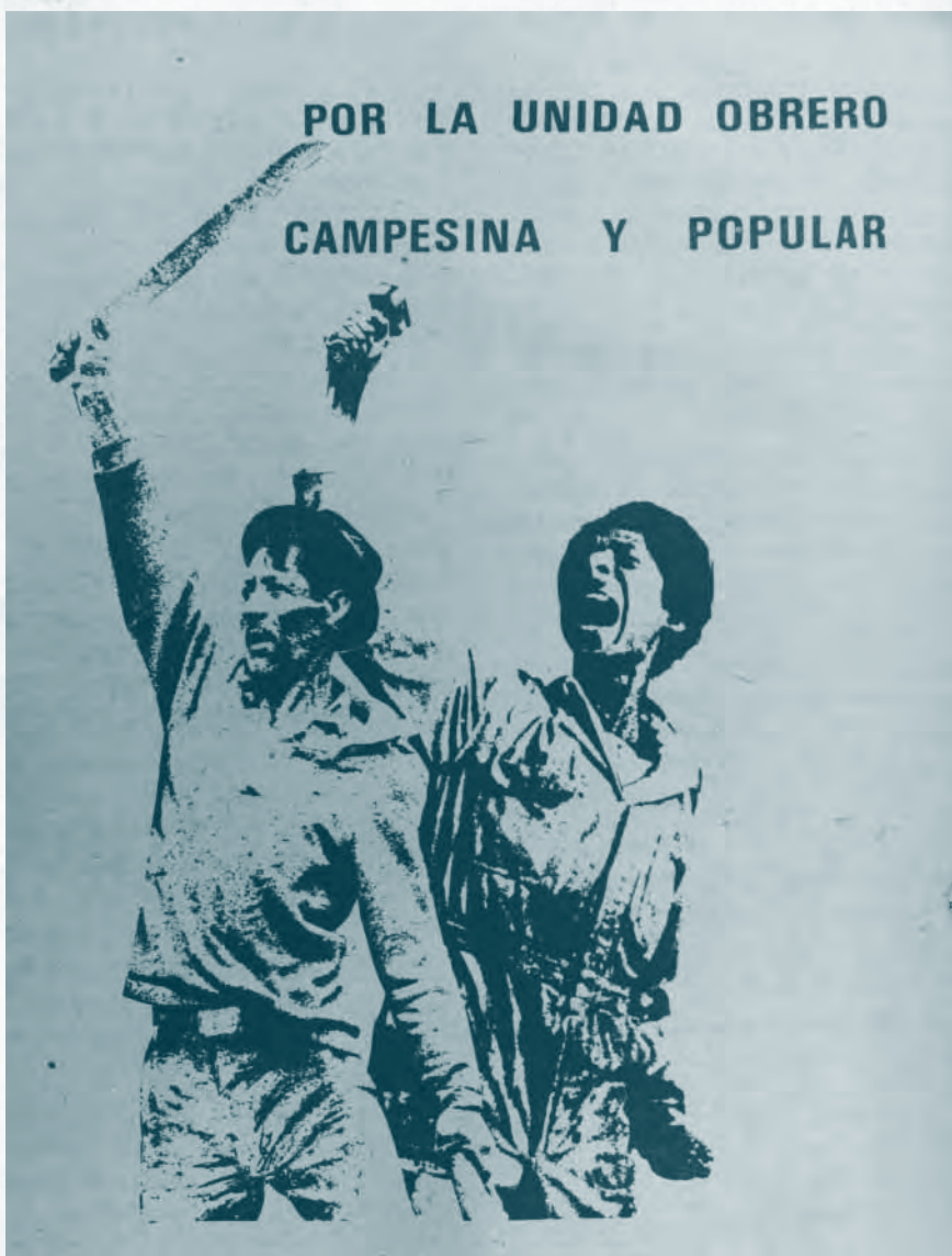
Carta Campesina. Vol. 33 marzo 1976