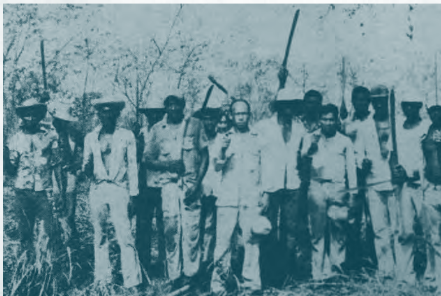
Carta Campesina. Vol. 40 mayo 1979

Como en Colombia no se había conformado una verdadera organización representativa del campesinado, el proceso de reforma agraria simplemente se había estancado y mutilado. Por otro lado, al frente de la organización de la reforma no se había manifestado un elemento consciente de dirección campesina, sino que la manipulación de la burguesía terrateniente siempre se encargaba de poner