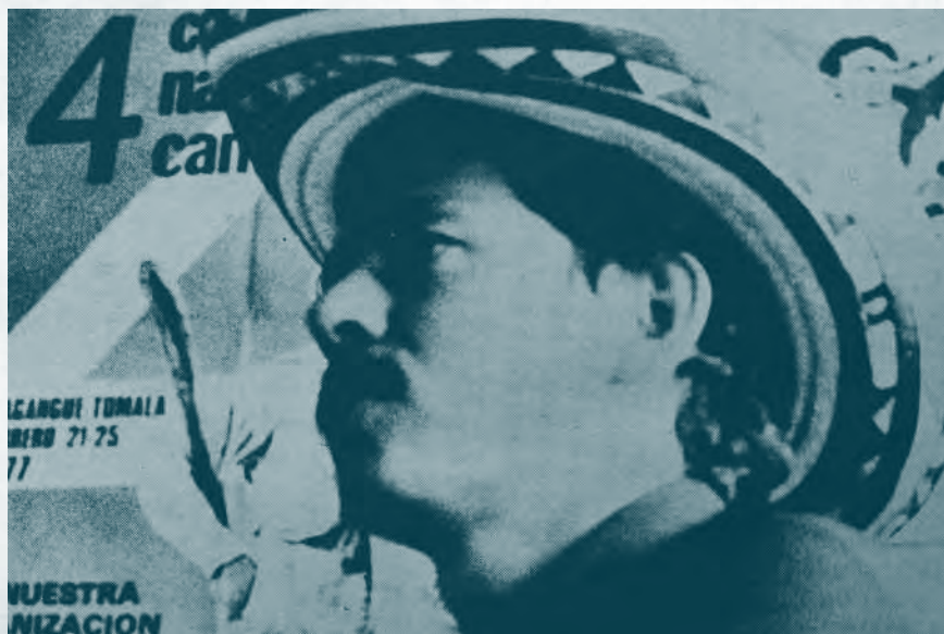
Carta Campesina. Vol. 37 abril 1977

Las discusiones sobre los efectos del DRI, la represión a la que eran sometidos los directivos de la ANUC y las diferencias internas dentro de la organización campesina se constituyeron como los temas en el telón de fondo de la situación real de los Usuarios Campesinos.