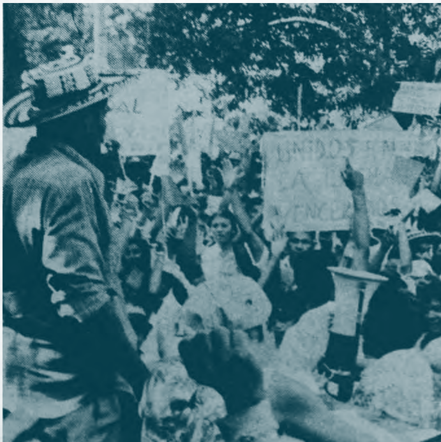
Carta Campesina. Vol. 36 febrero 1977

El 20 de julio de 1972 tuvo lugar en Sincelejo el acto de masas más numeroso y significativo que una organización campesina haya realizado. Ese día de fiesta patria fue propicio para que diez mil campesinos de todo el país se concentraran en la plaza de Majagual, desde donde recorrieron toda la calle Nariño hasta la Pajuela. Eventualmente tomaron la calle Francisco H. Porra, pasaron por el Parque Santander hasta la avenida Las Peñitas y de ahí tomaron rumbo a la plaza de toros, donde se realizó el acto de instalación.